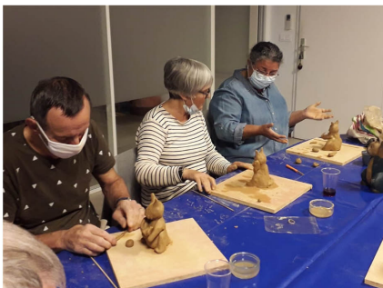
Atelier modelage sur argile