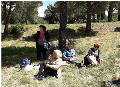
Pique nique et visite de l'Abbaye de Fontfroide