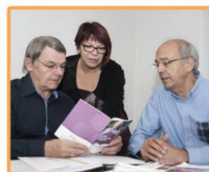
Formation des Aidants possible dans tout le département

Ne restez pas seul face à la maladie d'Alzheimer, osez en parler.