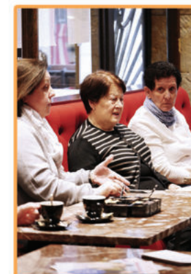
Café Mémoire et Convivialité