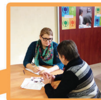
Entretien de conseils, soutien individualisé par une psychologue ou une A.M.P.