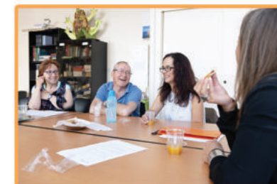
Groupe de paroles

Ne restez pas seul face à la maladie d'Alzheimer, osez en parler.